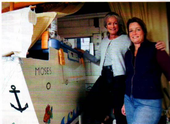
Her gennem lemmen i Mengstrasse i Lübeck kan fortvivlede mødre 24 timer i døgnet anonymt aflevere deres uønskede spædbørn.